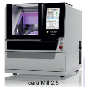
cara Mill 2.5

Deze compacte freesmachine is de oplossing voor de verwerking van de meeste dentale materialen zoals zirkonium, PMMA, was, lithiumdisilicaat en hybride materialen. Een nauwkeurige, ruimtebesparende en solide freesmachine voor natte en droge verwerking.